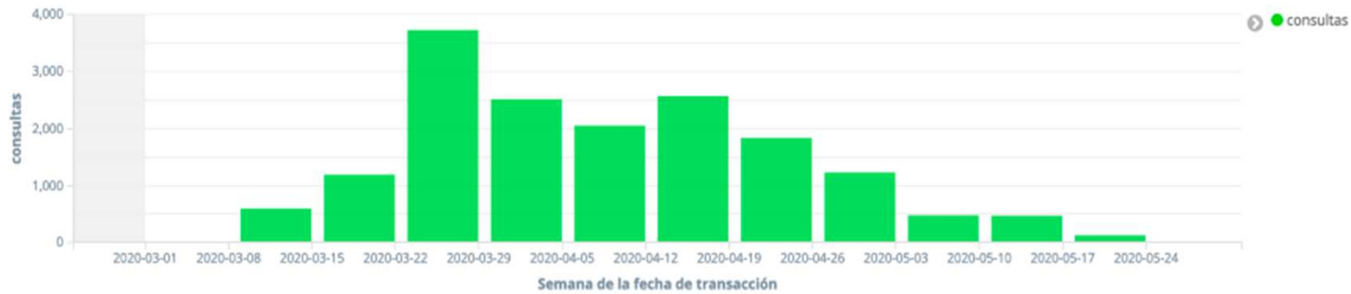
cb- Consultas COVID19 por semanas